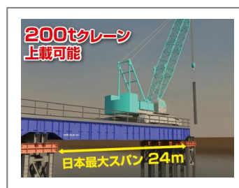
プレガーダーⅢ (工事用仮栈橋)