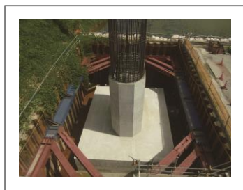
ヒロセメガビーム® (高強度腹起材)